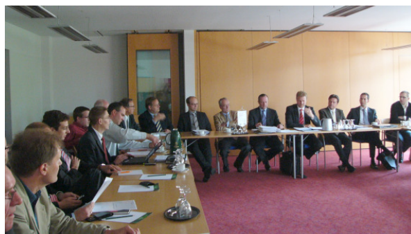
Vertreter des Handels und der Industrie diskutierten über neue Wege, um dem elektronischen Geschäftsdatenaustausch in der Baustoffbranche zum Durchbruch zu verhelfen.

Zusätzlich würden im Monatsdurchschnitt rund 1.000 Zugriffe von einzelnen Handelsunternehmen auf die Artikeldatensortimente der Industrie registriert. Zudem, so Schmidt-Kuhl, hätten attraktive Angebote an die Industrie ihre Wirkung nicht verfehlt, die Anzahl der beteiligten Lieferanten habe zugenommen. Etliche Lieferanten, deren Daten nach Beendigung der Kooperation mit der ZEDACH zunächst aus der IndustrieStammDatenbank entfernt werden mussten, konnten wieder gewonnen werden. Aktuell stellt die Datenbank über 360.000 Artikeldatensätze von 142 Lieferanten bereit. Darüber hinaus habe sich die BauDatenbank-Redaktion aktiv